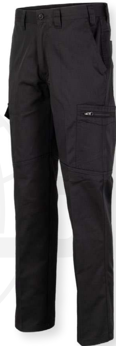
TABLA DE TALLAS